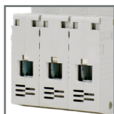
pojemność zacisków: 25mm 2