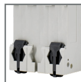
montaż na szynie DIN35