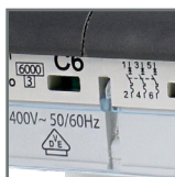
kontrolka sygnalizująca zadziałanie